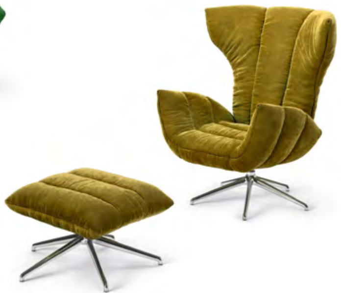
Stoff · Fabric · Tissu gold green 64 1978