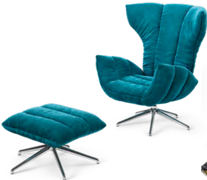
Stoff · Fabric · Tissu curacao 65 9622