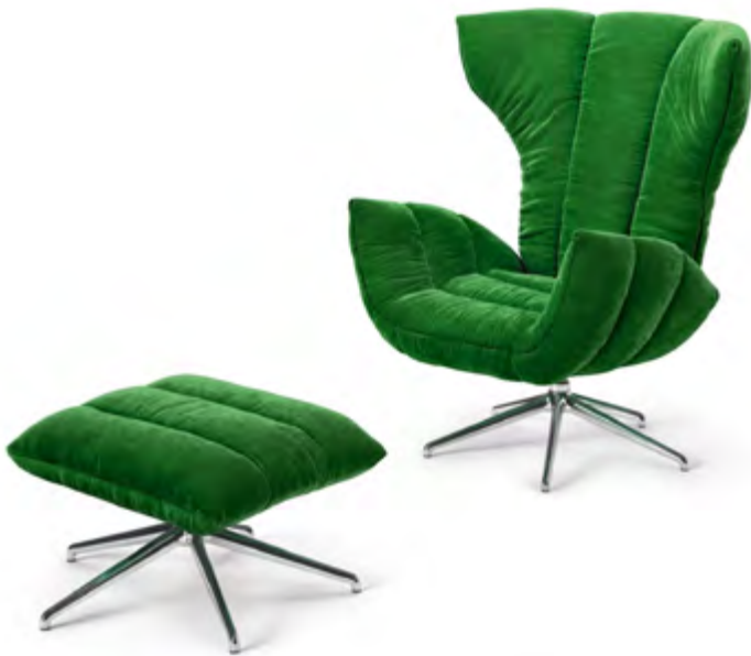
Stoff · Fabric · Tissu rainforest 66 8430