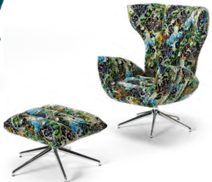
Stoff · Fabric · Tissu paradise 68 5135