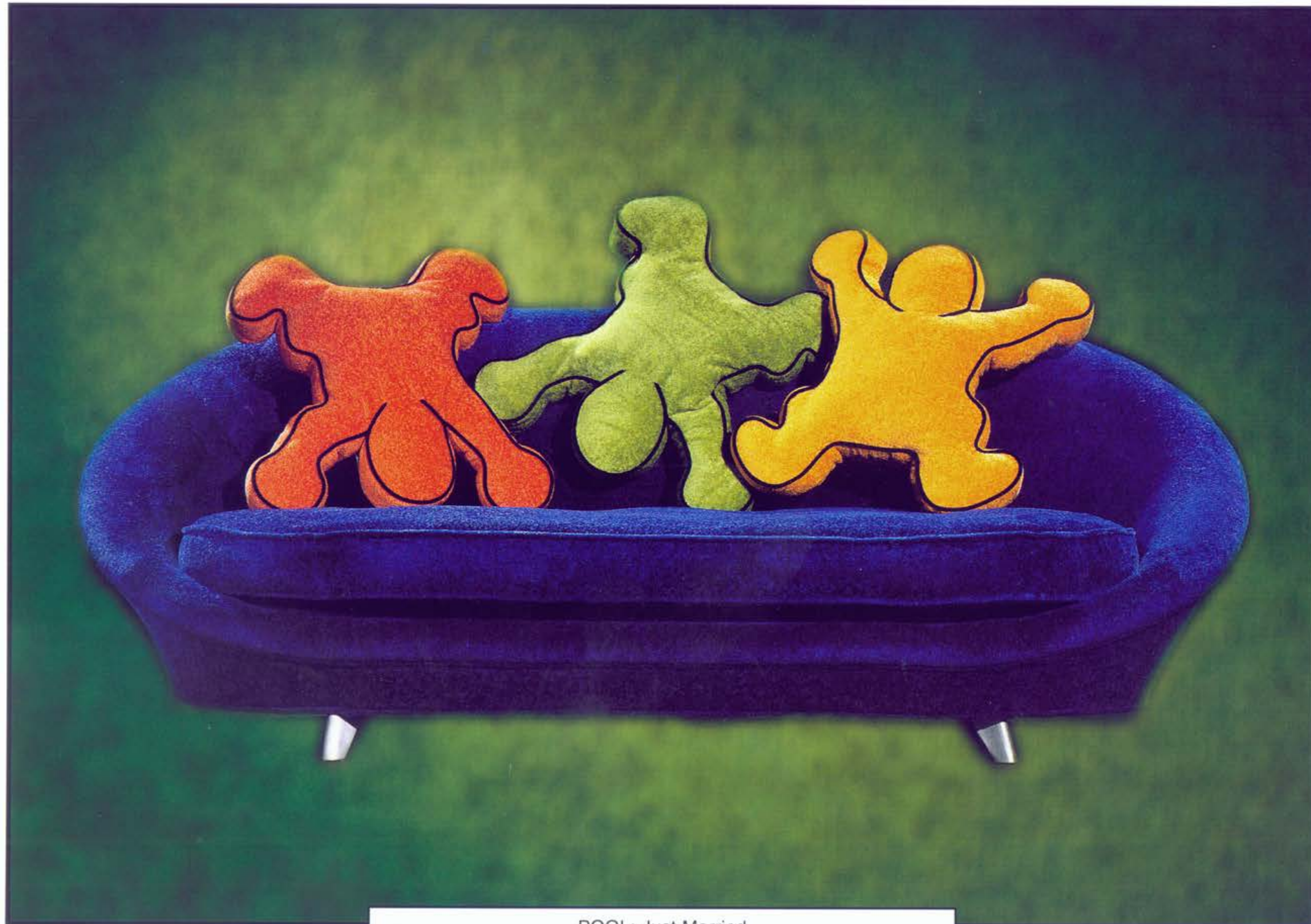
POOL: Just Married

BRETZ BROTHER DESIGN - Collection der BRETZ WOHNTRÄUME GMBH, Alexander-Bretz-Str. 2, D-55457 Gensingen