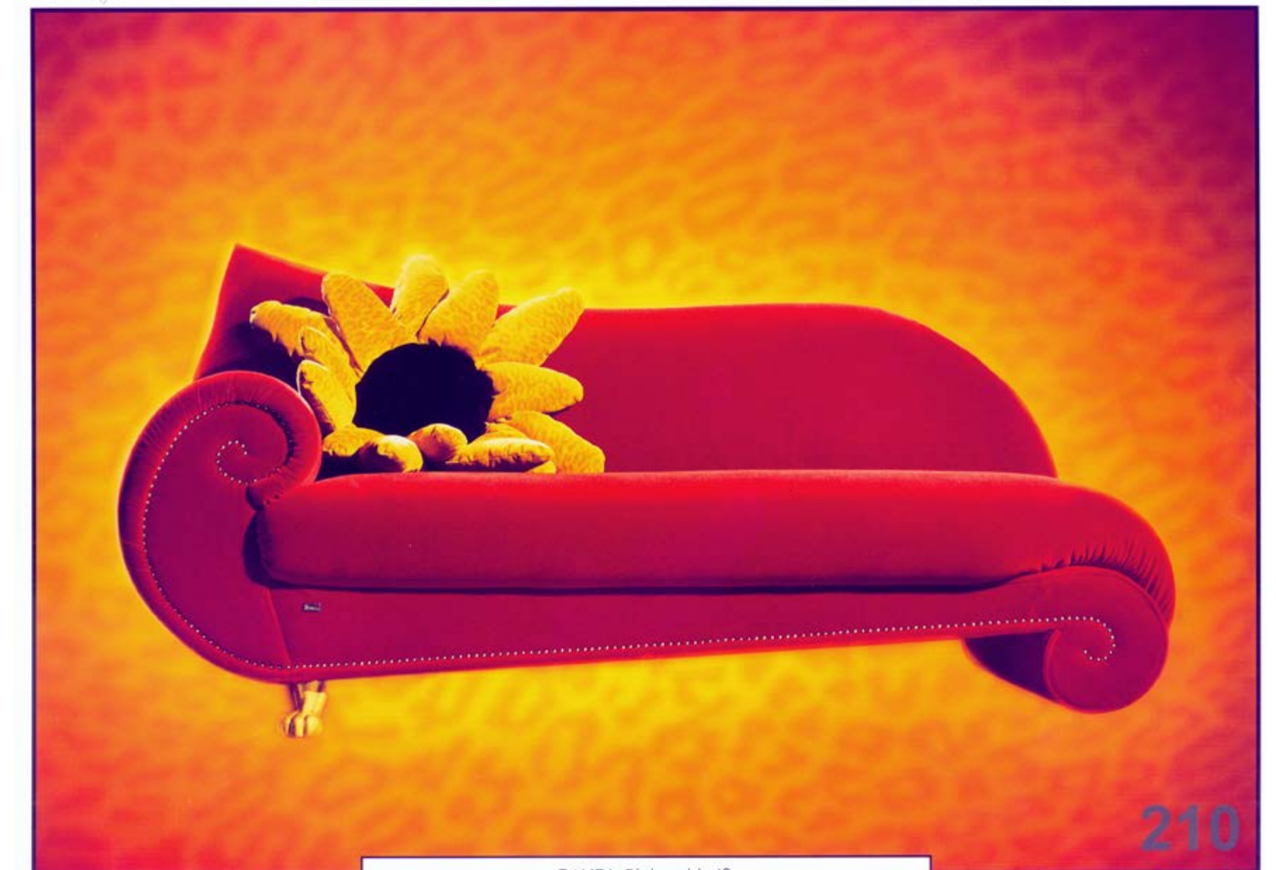
GAUDI: Blühend heiß.

CULT SOFA CHARACTERS BY BRETZ BROTHERS DESIGN