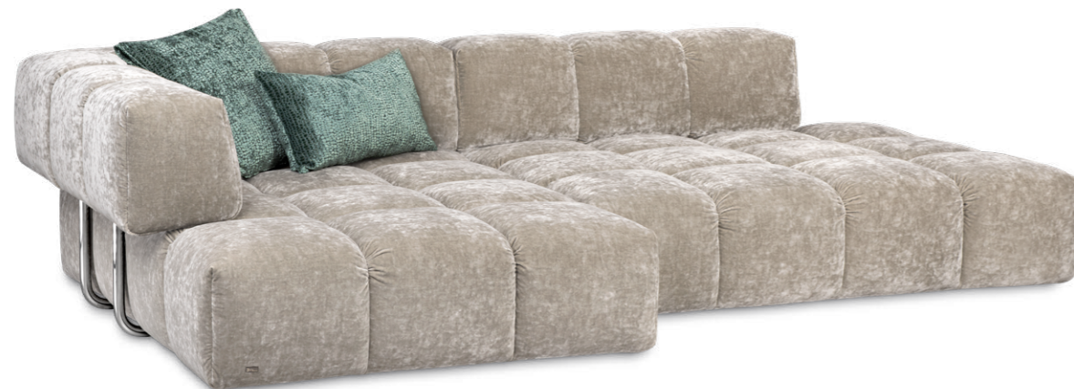
Q 107 LI EDGY ▶ 297 CM ▼ 175 CM ▲ 72 CM STOFF · FABRIC · TISSU 64 1985