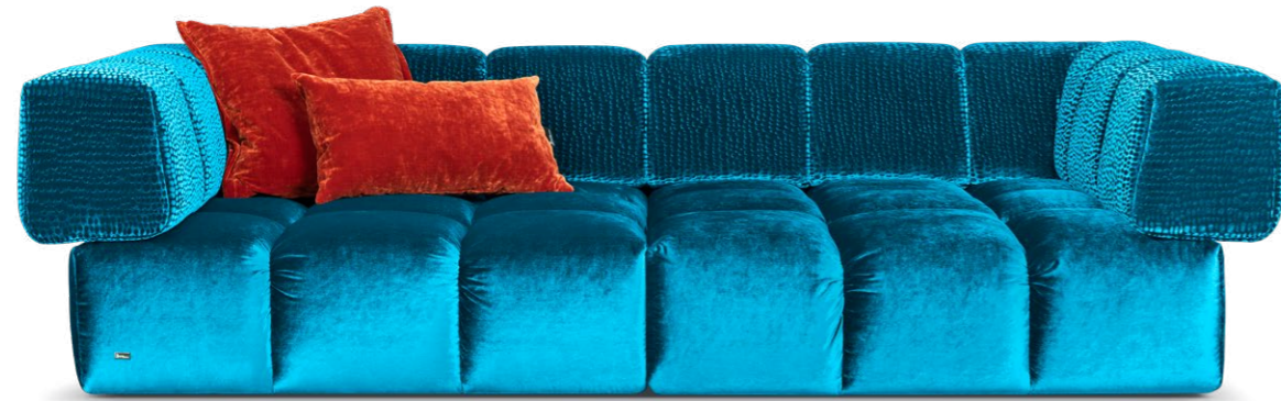
F 107 EDGY ▶ 270 CM ▼ 135 CM ▲ 72 CM STOFF · FABRIC · TISSU 61 9426 / 63 1524

Les caractères forts ont des angles et des bords très marqués et aiment leur liberté. Pourquoi ne pas réorganiser totalement le salon à 3 heures du matin ? Après tout, un changement de perspective n'a jamais fait de mal à personne. Reste à se poser les questions suivantes : méridienne à gauche ou à droite ? des dossiers, oui, non, peut-être ? Peu importe, car Edgy réunit tout dans un condensé clair de liberté et de cocooning. It's hip to be square.