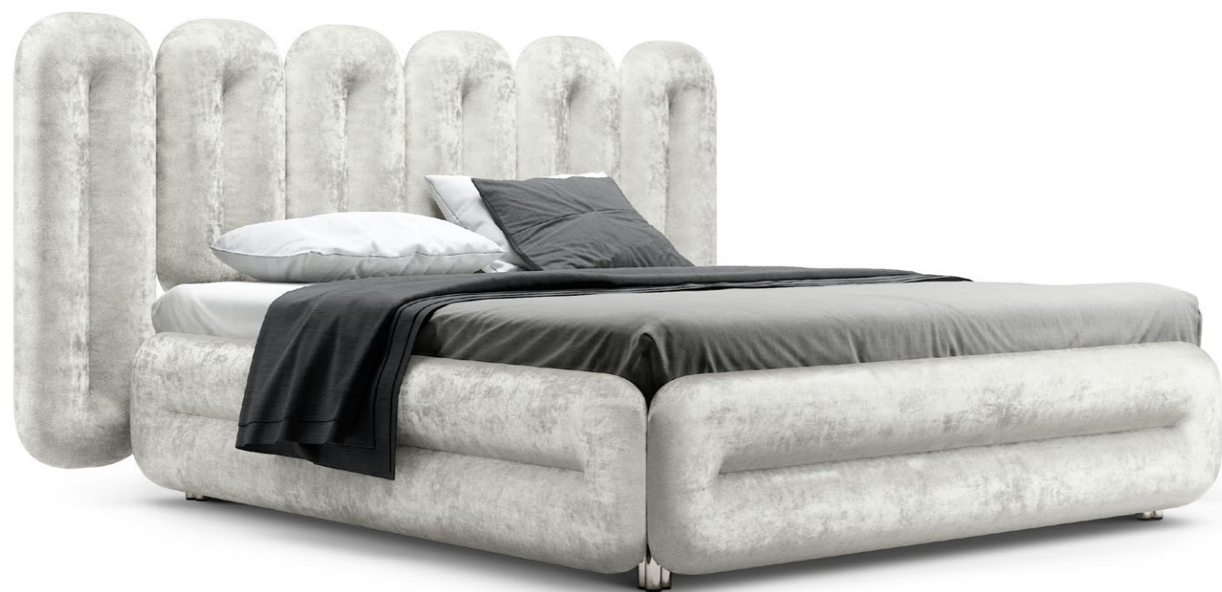
W 129C-180 ECLAIR ▶243 CM ▼224 CM ▲127 CM STOFF · FABRIC · TISSU 65 BOH06