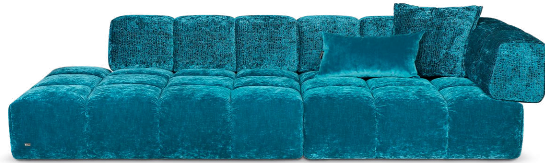
U-TN-RK-RE 107 EDGY ▶ 297 CM ▾ 135 CM ▲ 72 CM STOFF · FABRIC · TISSU 64 1922 / 65 0322