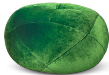
C 106 TERATAI Ø 66 CM ▶ 38 CM STOFF · FABRIC · TISSU 66 8430