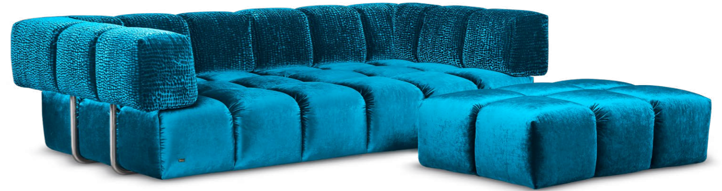
F 107 EDGY ▶ 270 CM ▼ 135 CM ▲ 72 CM STOFF · FABRIC · TISSU 61 9426 / 63 1524