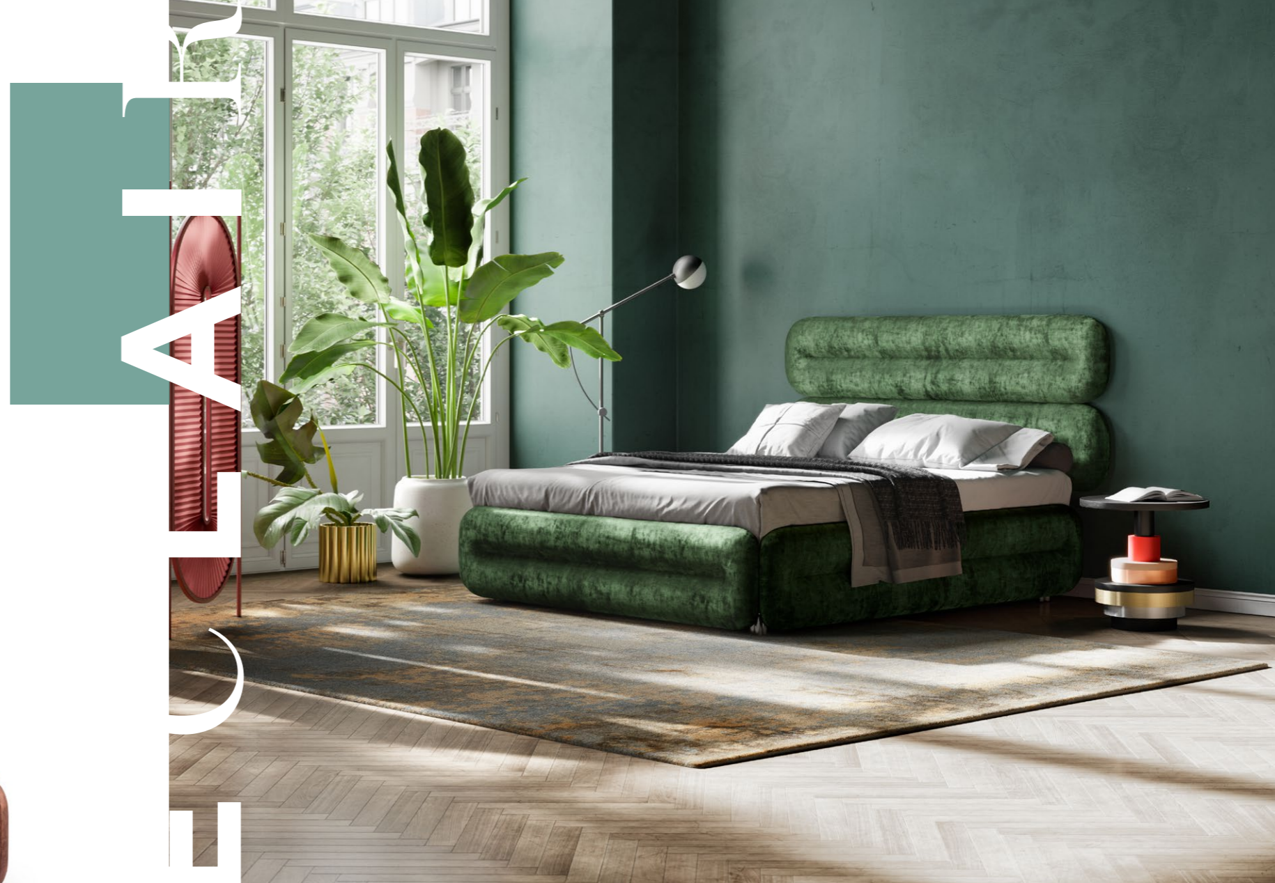
W 129-180, 1 × RP129-200-2 ECLAIR ▶200,5 CM ▼216 CM ▲128 CM STOFF · FABRIC · TISSU 65 BOH71