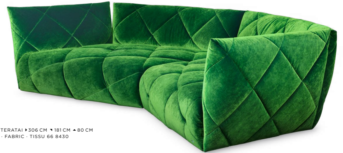
G 106 TERATAI ▶ 306 CM ▼ 181 CM ▲ 80 CM STOFF · FABRIC · TISSU 66 8430