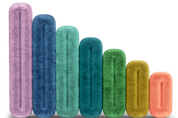
WASSERFALL 129 RP200, RP180, RP160, RP140, RP120, RP100, RP80 STOFF · FABRIC · TISSU 65 BOH86 / 65 BOH78 / 65 BOH75 / 65 BOH73 / 65 BOH70 / 65 BOH41 / 65 BOH63

Wie man sich bettet, so träumt man. Und nirgendwo so süß wie in unserem Bett Éclair! Das arkadenförmige Betthaupt ist dabei so vielfältig wie die größte Auswahl der besten Pâtisseries von Paris. So wird ECLAIR zu mehr als einem Bett: Es wird zu einem plastischen Ornament im Raum! "Sweet dreams are made of this."