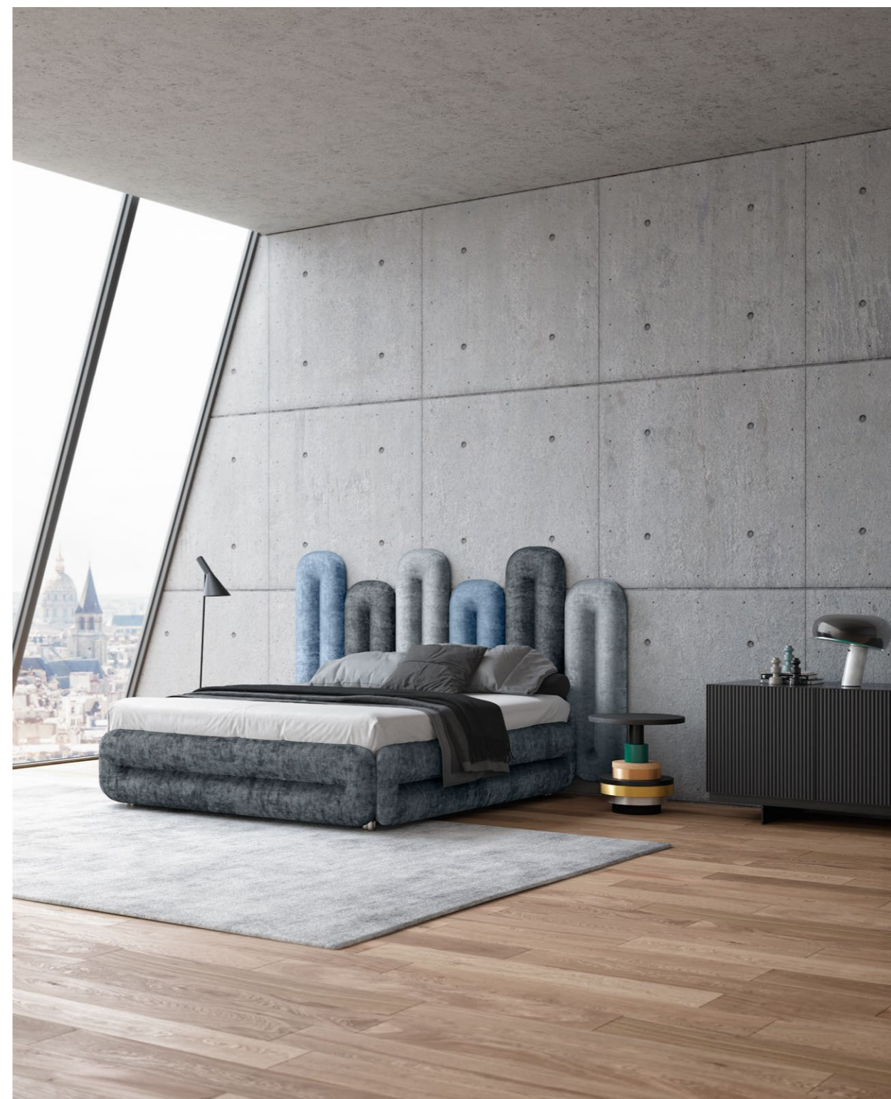
W 129A-180 ECLAIR (SET 1.2) ▶243 CM ▼224 CM ▲147 CM STOFF · FABRIC · TISSU 65 BOH84 / 65 BOH14 / 65 BOH76