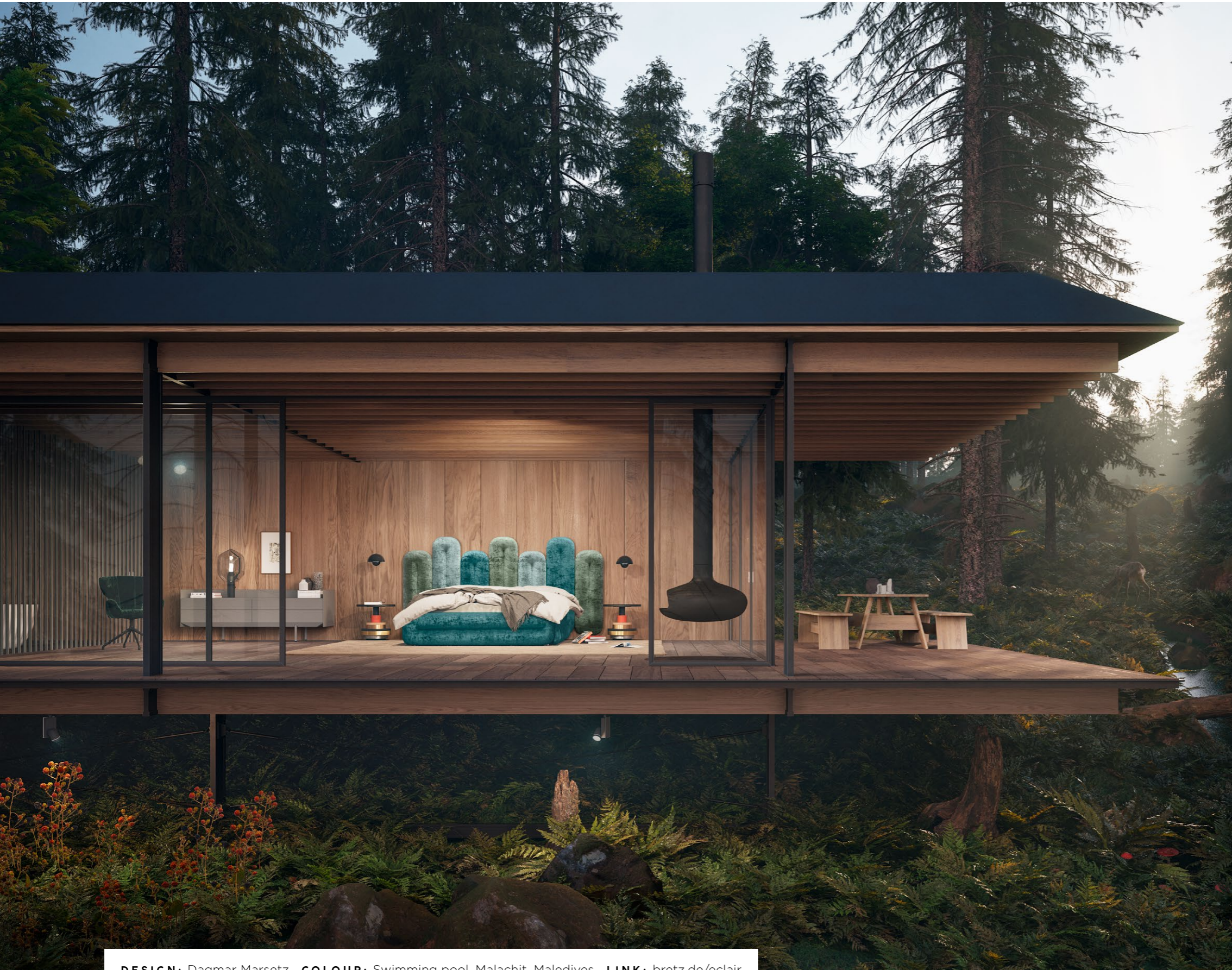
DESIGN: Dagmar Marsetz COLOUR: Swimming pool, Malachit, Maledives LINK: bretz.de/eclair