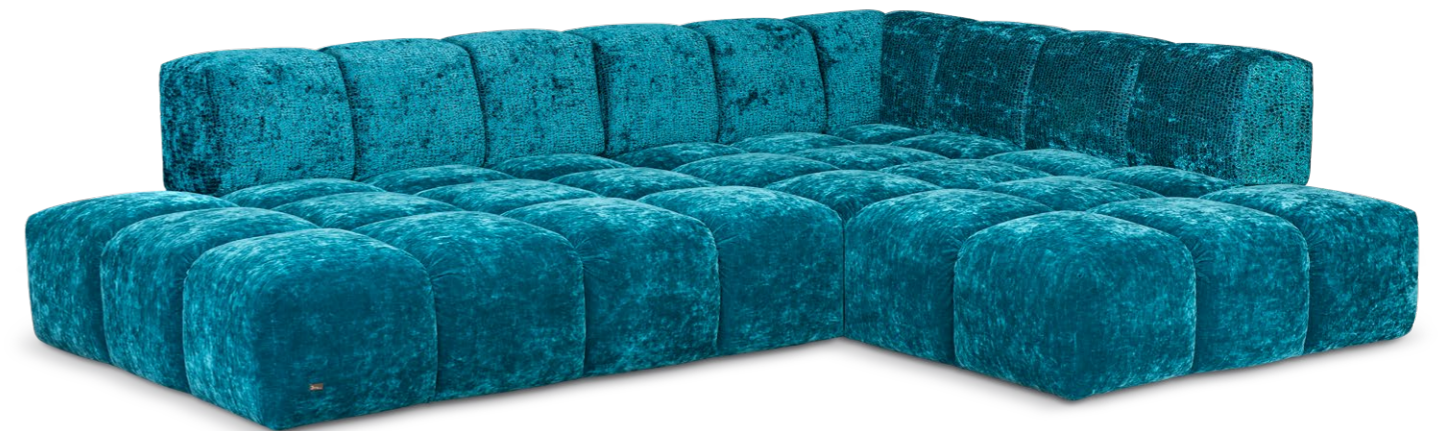
Y 107 RE EDGY ▶ 297 CM ▾ 215 CM ▲ 72 CM STOFF · FABRIC · TISSU 64 1922 / 65 0322