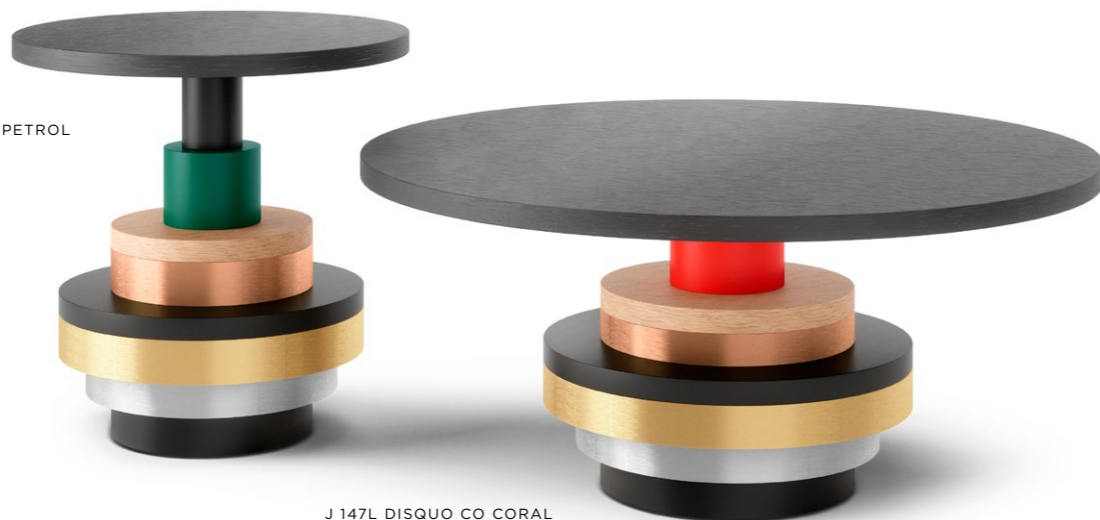
J 147L DISQUO CO CORAL Ø 90 CM ▲ 42 CM