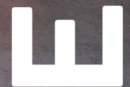
DESIGN: Pauline Junglas COLOUR: Amalfi, Blue moss LINK: bretz.de/edgy