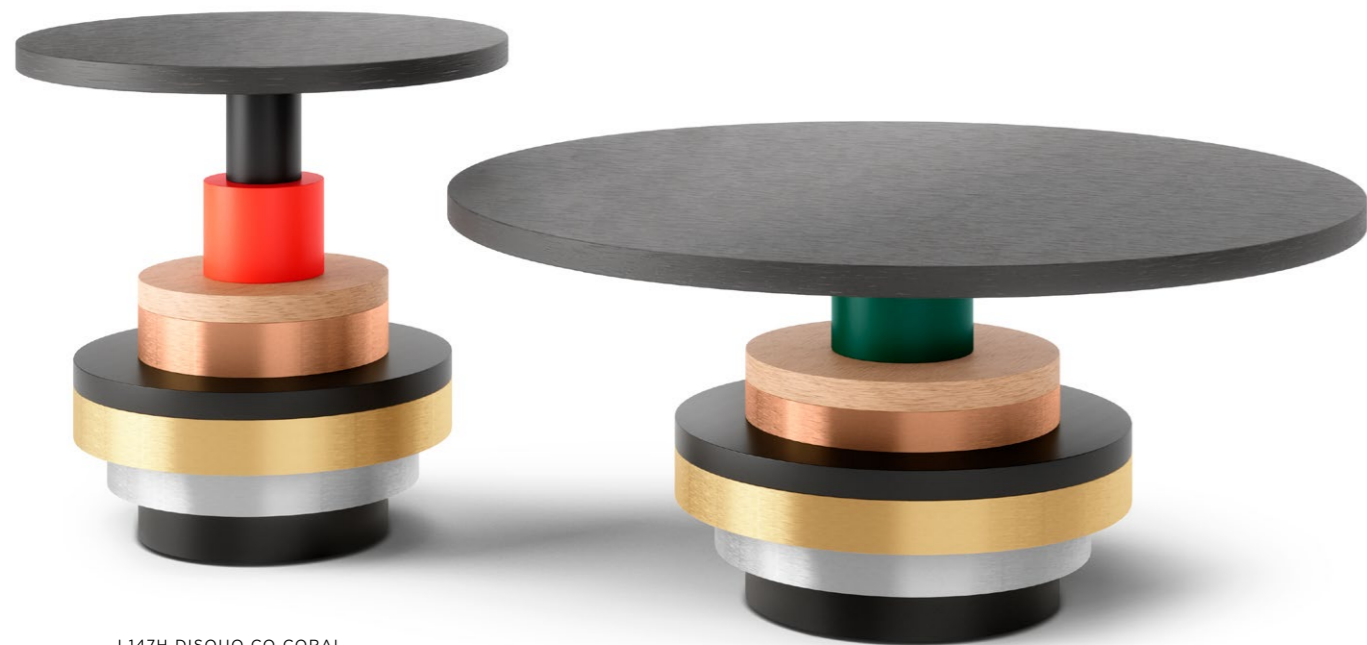
J 147H DISQUO CO CORAL Ø 52 CM ▲ 53 CM