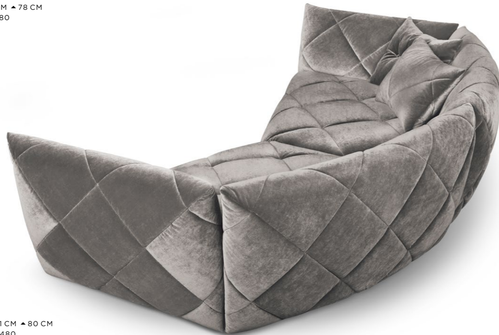
G 106 TERATAI ▶ 306 CM ▼ 181 CM ▲ 80 CM STOFF · FABRIC · TISSU 66 8480