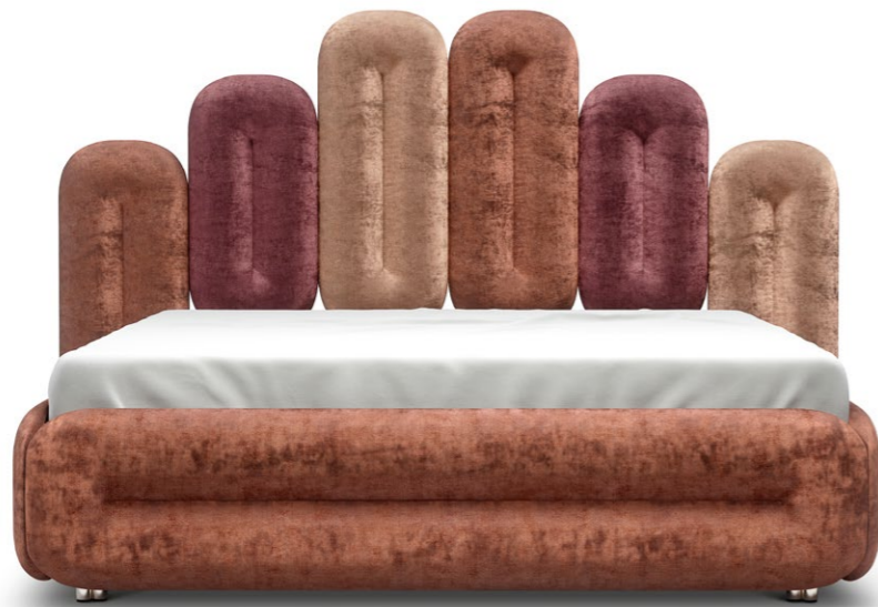
W 129B-180 ECLAIR (SET 2.2) ▶243 CM ▼224 CM ▲147 CM STOFF · FABRIC · TISSU 65 BOH54 / 65 BOH58 / 65 BOH74

Comme on fait son lit, on se couche. Et cela ne peut pas être plus plaisant que dans notre lit Éclair ! La tête de lit en accordéon est aussi polyvalente que le choix des meilleurs pâtisseries de Paris. Ainsi, ECLAIR est bien plus qu'un simple lit : c'est un ornement décoratif de la pièce ! «Sweet dreams are made of this.»