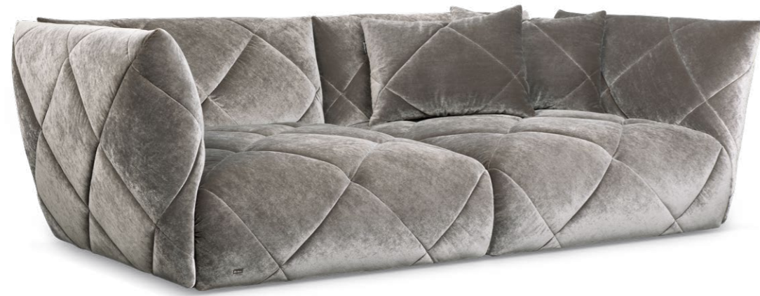
F 106 TERATAI ▶ 256 CM ▼ 134 CM ▲ 80 CM STOFF · FABRIC · TISSU 66 8480