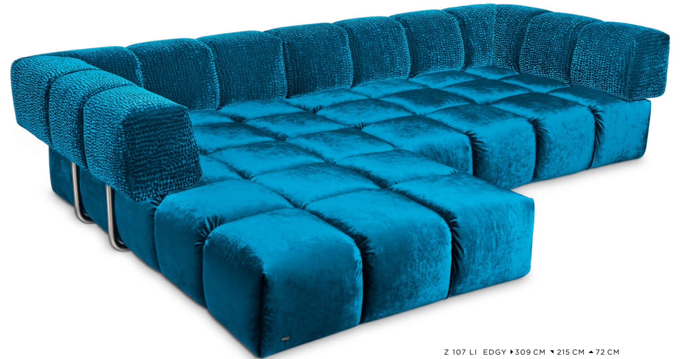
Z 107 LI EDGY ▶ 309 CM ▼ 215 CM ▲ 72 CM STOFF · FABRIC · TISSU 61 9426 / 63 1524