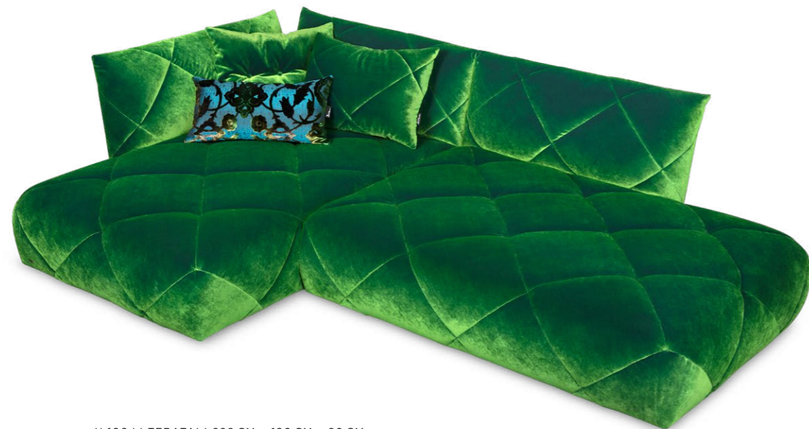
H 106 LI TERATAI ▶ 299 CM ▶ 190 CM ▶ 80 CM STOFF · FABRIC · TISSU 66 8430

Teratai est idéal pour vous échapper et prendre un peu de recul, voire pour en prendre beaucoup. Tel un nymphéa exotique, le canapé Teratai se dévoile dans la pièce et devient votre oasis personnelle. Laissez-vous bercer doucement. Des coutures à sa forme, ce canapé se montre poétique et apaisant. Belong to the world.