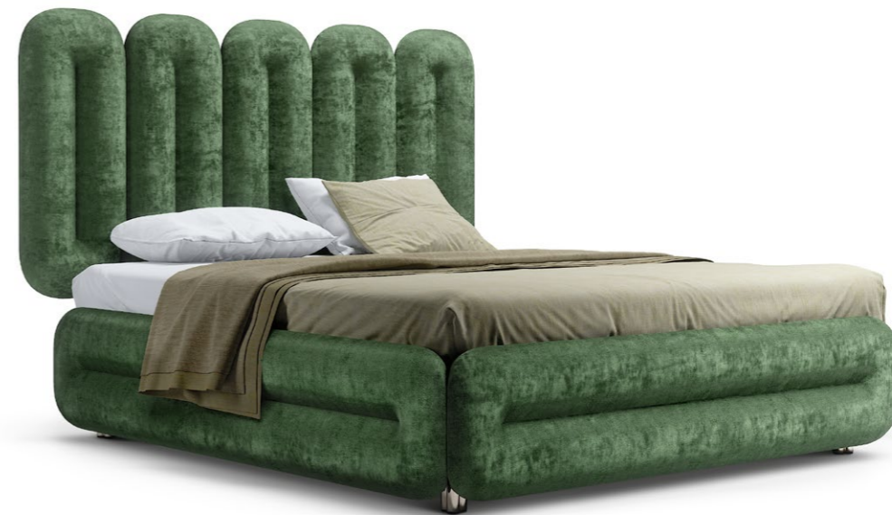
W 129-180, 2 × RP129-100-2, 1 × RP129-100 ECLAIR ▶202,5 CM ▼216 CM ▲147 CM STOFF · FABRIC · TISSU 65 BOH71