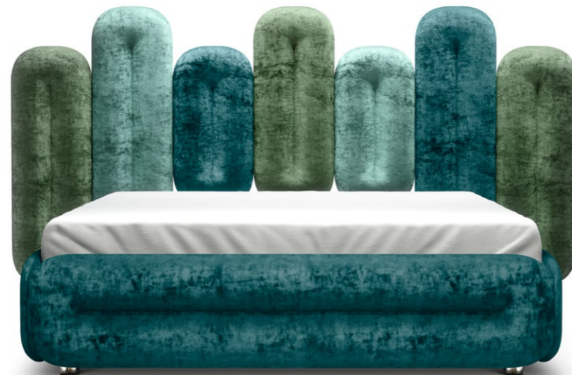
W 129-180 ECLAIR (SET 3) ▶ 283,5 CM ▼ 224 CM ▲ 147 CM STOFF · FABRIC · TISSU 65 BOH73 / 65 BOH71 / 65 BOH75