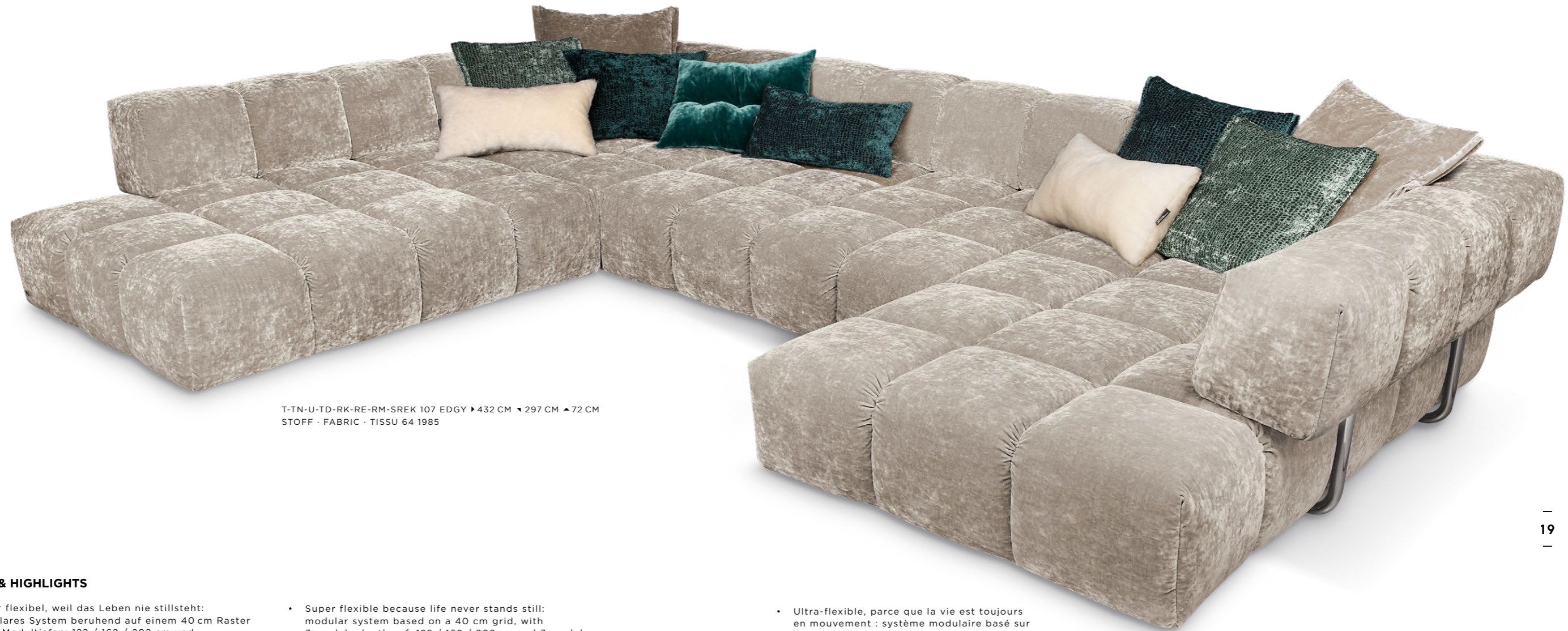
T-TN-U-TD-RK-RE-RM-SREK 107 EDGY ▶ 432 CM ▼ 297 CM ▲ 72 CM STOFF · FABRIC · TISSU 64 1985