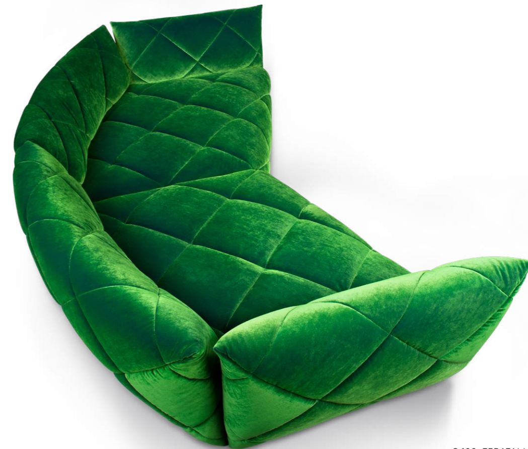
G 106 TERATAI ▶ 306 CM ▼ 181 CM ▲ 80 CM STOFF · FABRIC · TISSU 66 8430

Teratai ist Dein Platz für die kleine Flucht zwischendurch. Und für die Große - wenn's mal sein muss. Wie eine exotische Seerose entfaltet sich Teratai im Raum und wird zu Deiner persönlichen Oase. Sanft geschwungen - von den Nähten bis zur Form - wirkt das poetisch-emotionale Sofa skulptural und in sich ruhend. Belong to the world.