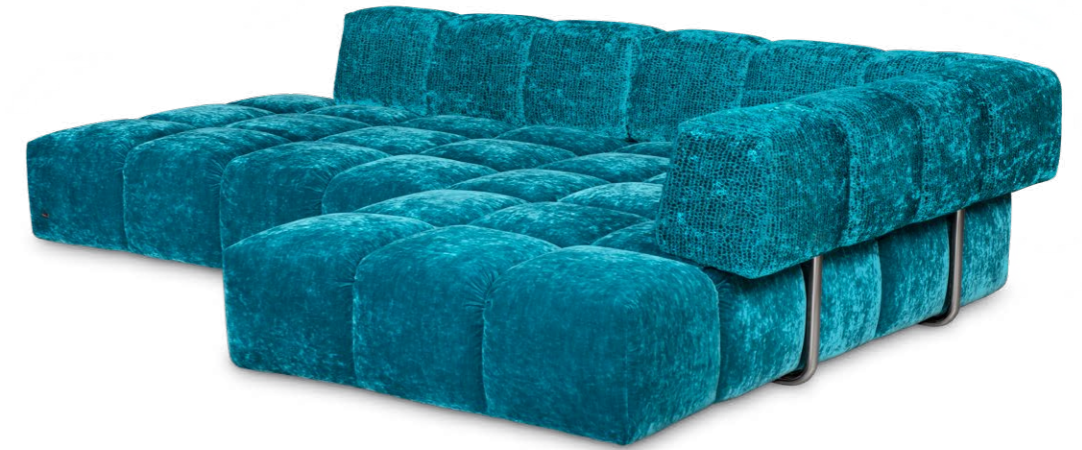
Y 107 RE EDGY ▶ 297 CM ▾ 215 CM ▲ 72 CM STOFF · FABRIC · TISSU 64 1922 / 65 0322

Echte Charakterköpfe haben Ecken und Kanten und lieben ihre Freiheit. Warum also nicht um 3 Uhr nachts mal eben das Wohnzimmer auf den Kopf stellen? Schließlich hat ein Perspektivenwechsel noch niemandem geschadet. Stellt sich nur die Frage: Récamière links, Récamière rechts? Rückenlehne, ja, nein, vielleicht? Ganz egal, denn Edgy verbindet mit seiner klaren, konstruktiven Art maximale Freiheit mit maximaler Cosyness! It's hip to be square.