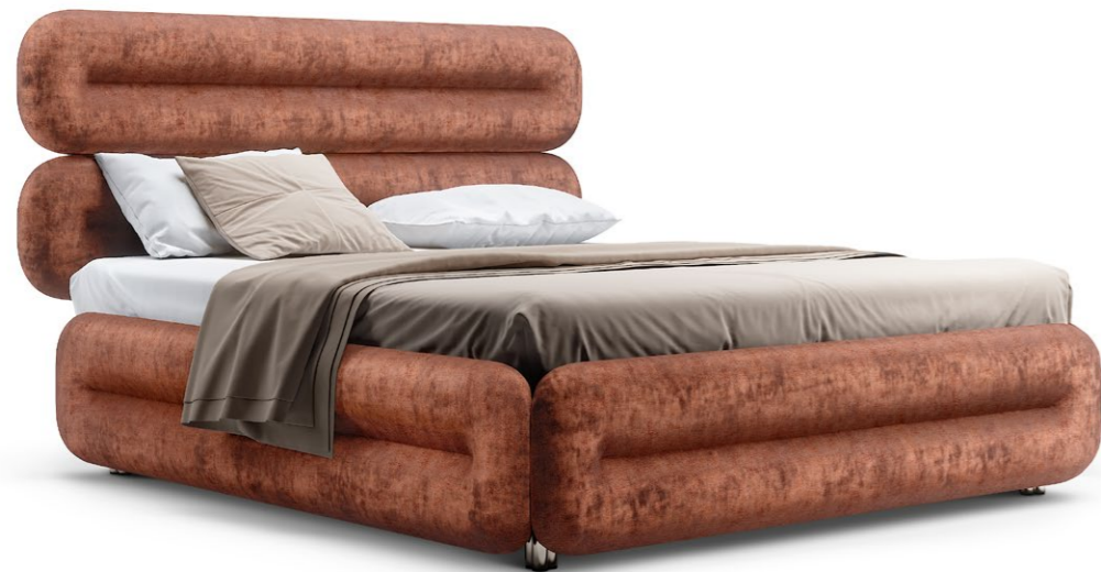
W 129-180, 1 × RP129-200-2 ECLAIR ▶200,5 CM ▼216 CM ▲128 CM STOFF · FABRIC · TISSU 65 BOH54