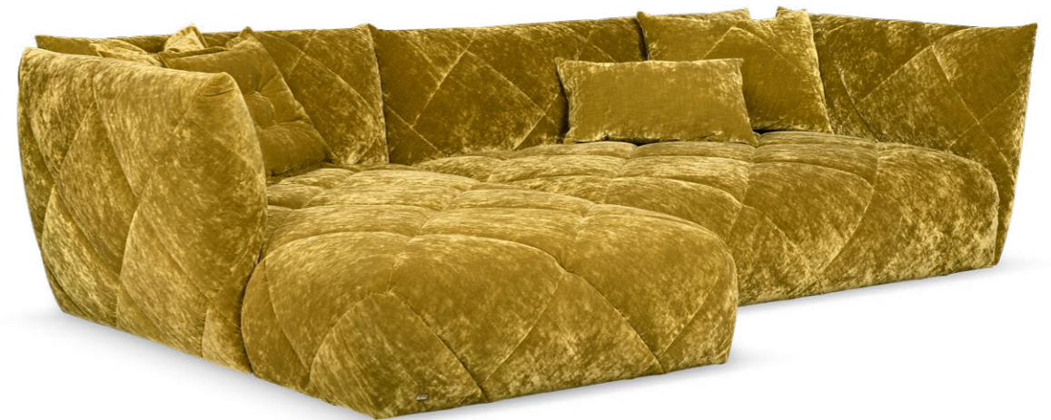
Z 106 LI TERATAI ▶ 312 CM ▶ 190 CM ▶ 80 CM STOFF · FABRIC · TISSU 64 1978