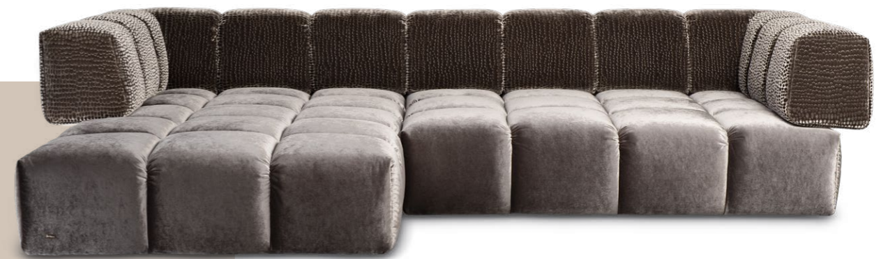
Z 107 LI EDGY ▶ 309 CM ▼ 215 CM ▲ 72 CM STOFF · FABRIC · TISSU 61 9487 / 63 1584