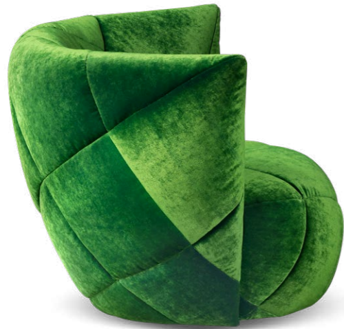
A 106 TERATAI ▶ 105 CM ▶ 93 CM ▶ 78 CM STOFF · FABRIC · TISSU 66 8430