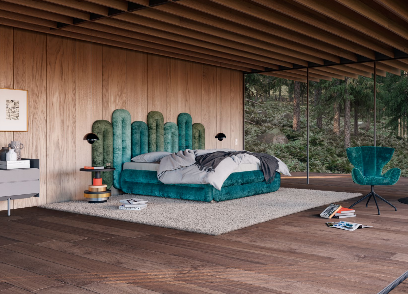
W 129-180 ECLAIR (SET 3) ▶ 283,5 CM ▼ 224 CM ▲ 147 CM STOFF · FABRIC · TISSU 65 BOH73 / 65 BOH71 / 65 BOH75