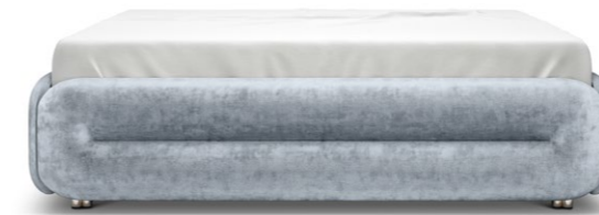
W-129-180 ECLAIR ▶ 196 CM ▼ 216 CM ▲ 55 - 59 CM STOFF · FABRIC · TISSU 65 BOH76