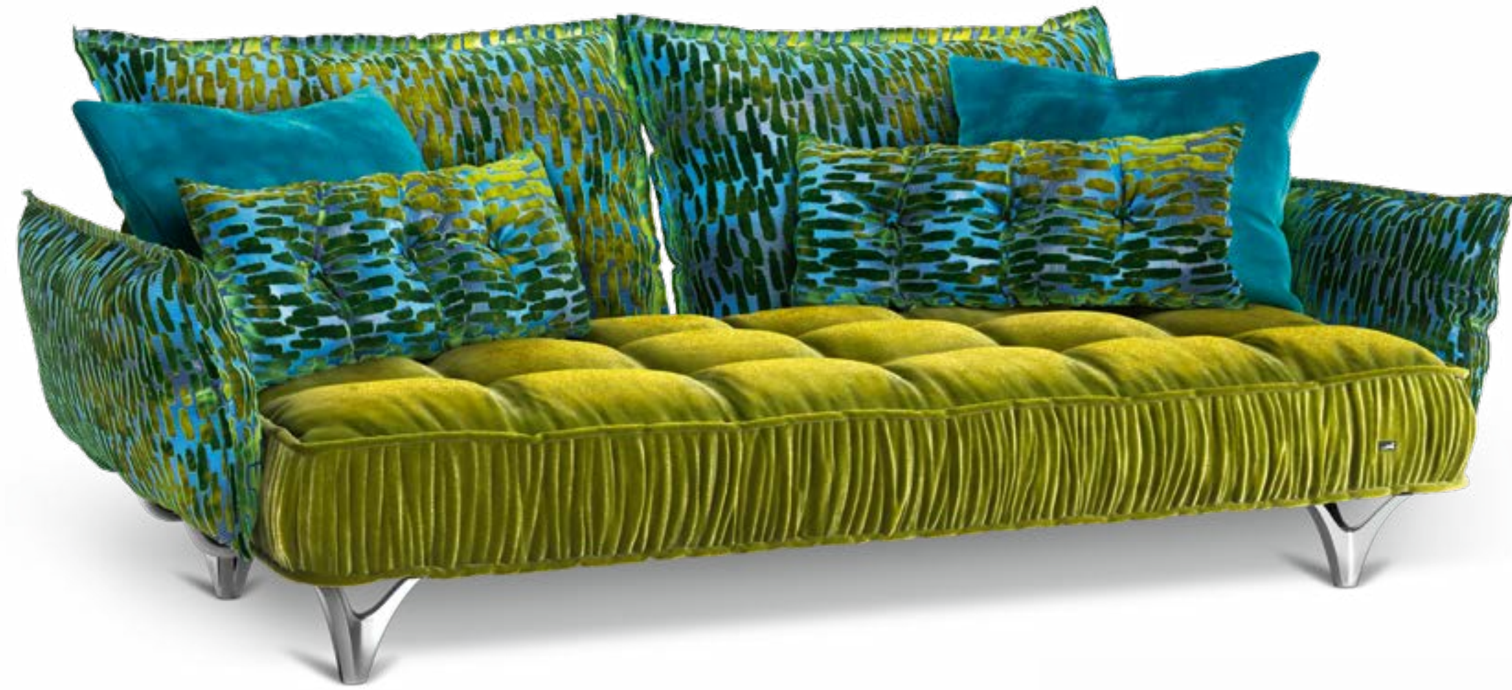
Ohlinda FN L x P x H 230 x 130 x 88 cm Tissu: midsummer oliv | sea breeze