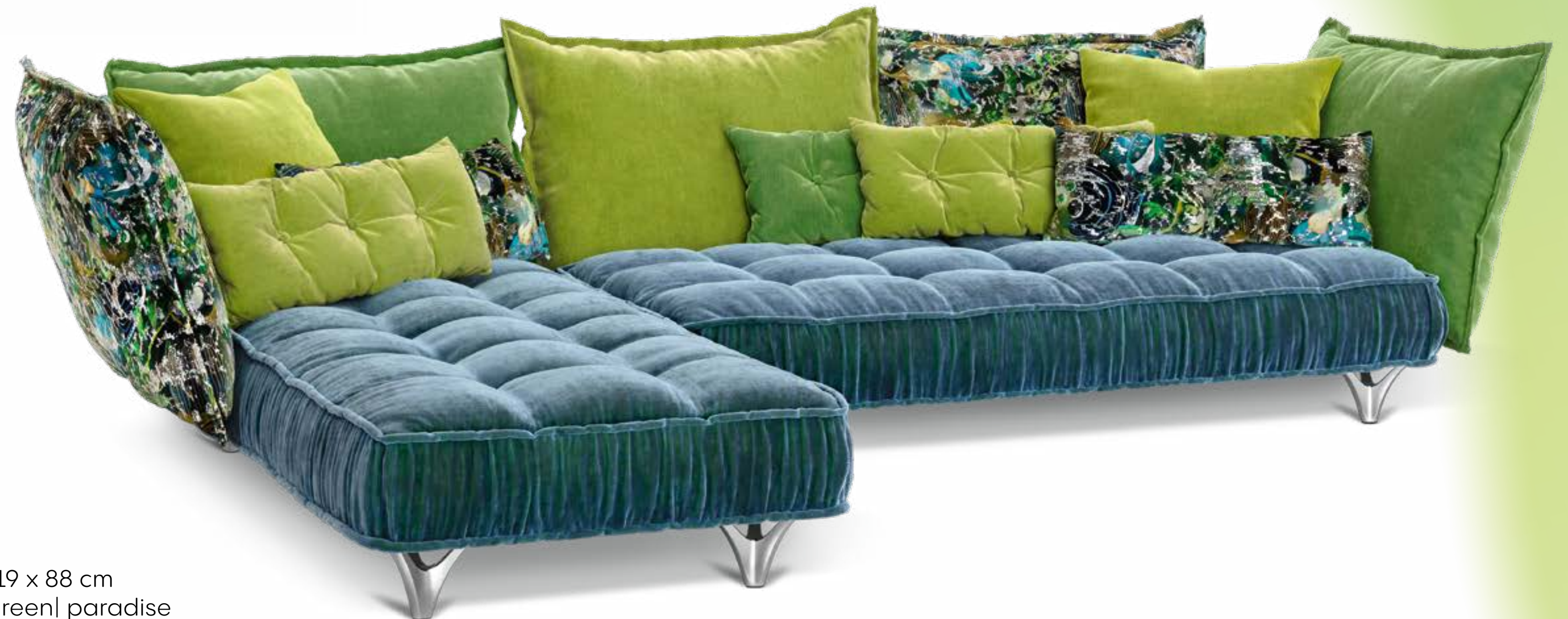
Ohlinda Z li (Set 3) L x P x H 349 x 219 x 88 cm Tissu: blue hour | jamaica | sunny green | paradise