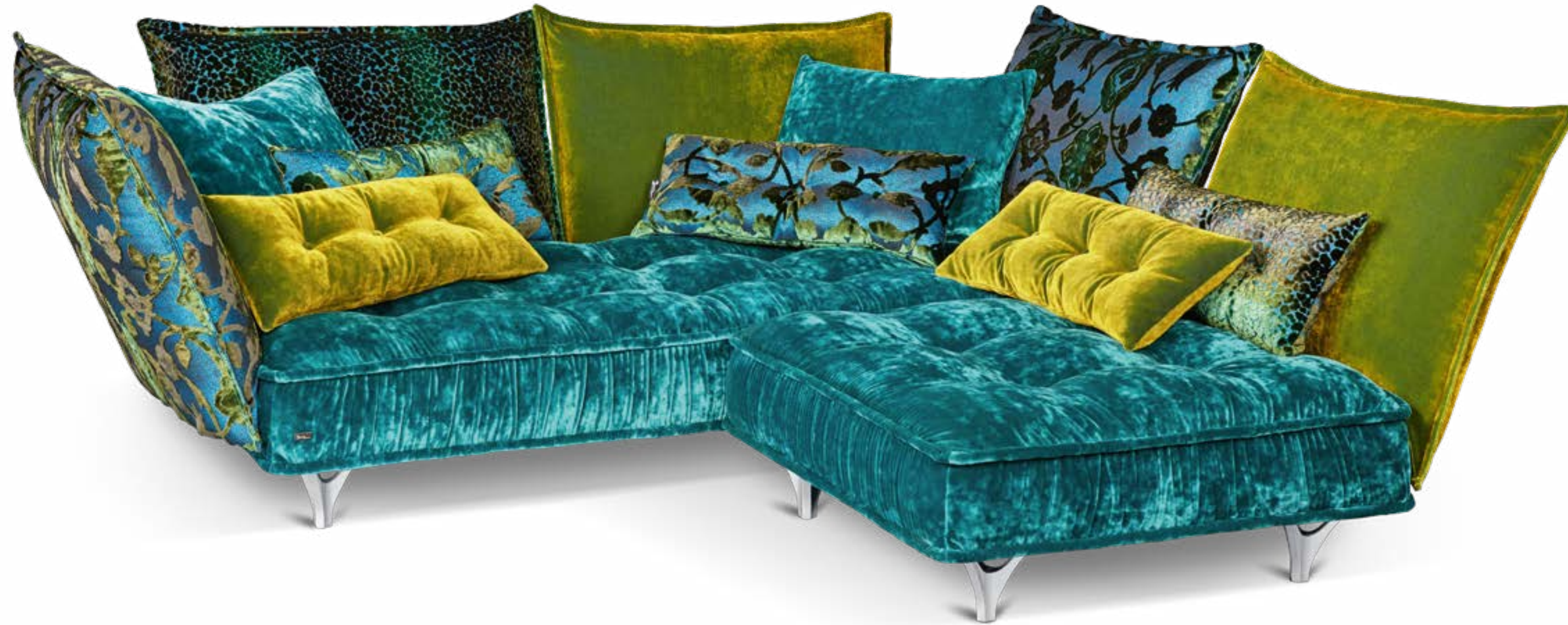
Ohlinda Mre L x P x H 253 x 219 x 88 cm Tissu: curacao | midsummer oliv | arabesk | boa türkis