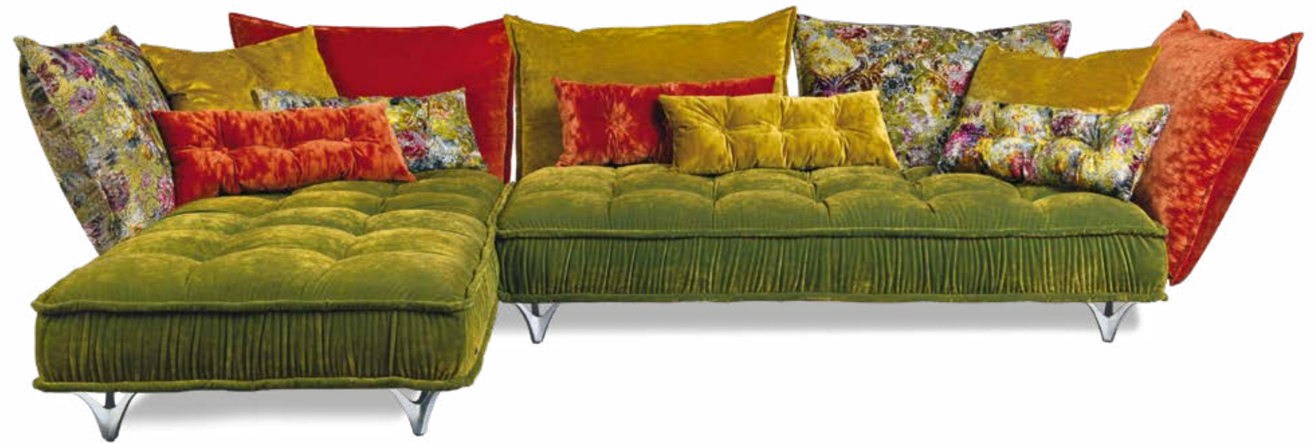
Ohlinda Z li (Set 3) L x P x H 349 x 219 x 88 cm Tissu: midsummer oliv | gold | orange | gobelin

Pour tous ceux qui apprécient l'individualité, les coussins d'accoudoir et de dossier ainsi que les assises peuvent être recouverts, comme un collage tridimensionnel, de différents tissus et motifs de la collection.