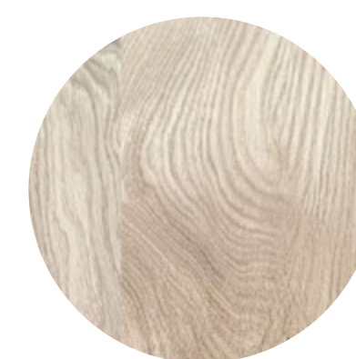
Chêne huilé blanc