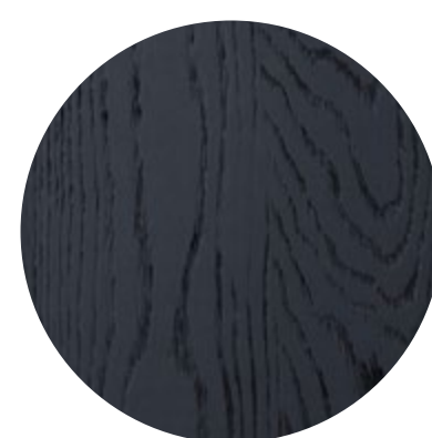
Chêne noir brossé

Maona propose de multiples configurations à partir de trois formes de base clairement définies : un plateau rond, un format rectangulaire et une forme « bateau » délicatement étirée. Toutes les variantes présentent l'arête suisse caractéristique et peuvent être réalisées dans cinq essences de bois massif – du chêne naturel ou huilé blanc au « Chêne noir » profondément brossé et au « Chêne meteor » à l'aspect minéral, jusqu'au noyer américain.