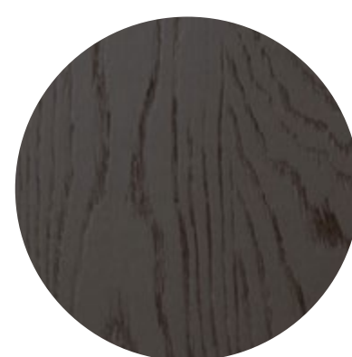
Chêne meteor brossé