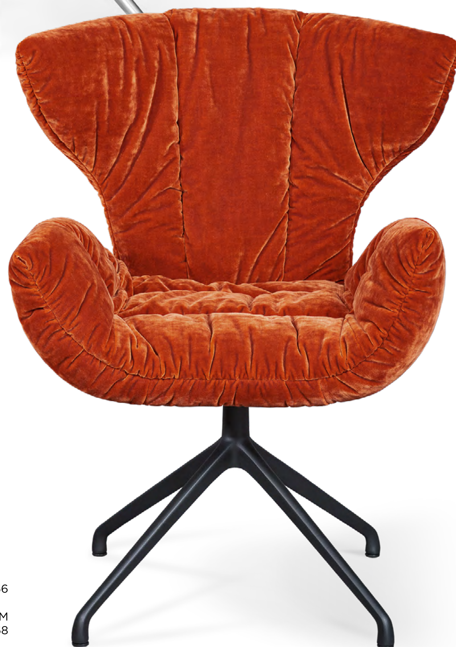
CASSIA CHAIR B156

➤ 67 CM ↗ 57 CM ▲ 87 CM STOFF • FABRIC • TISSU 641978