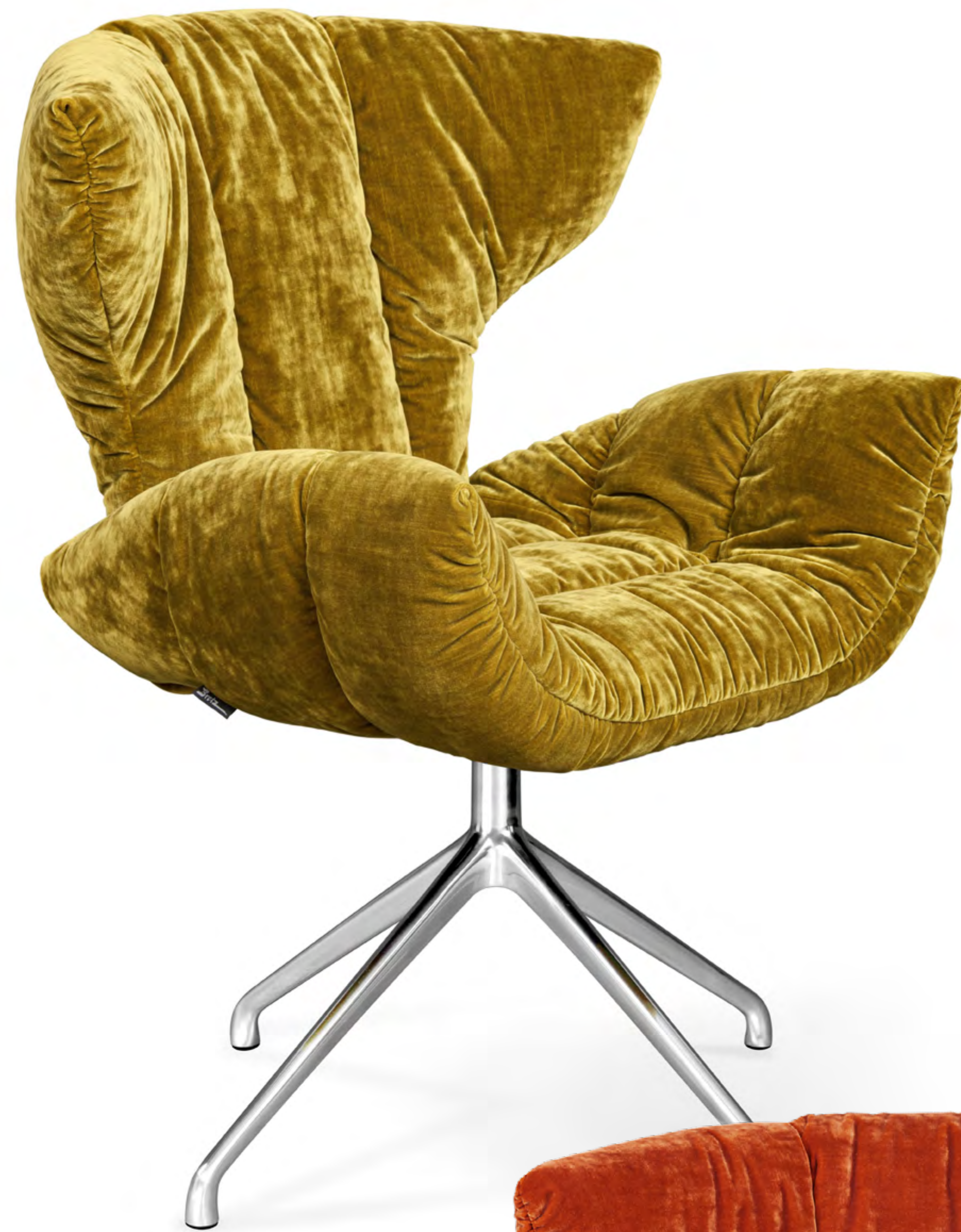
CASSIA CHAIR B156

➤ 67 CM ↗ 57 CM ▲ 87 CM STOFF • FABRIC • TISSU 641978