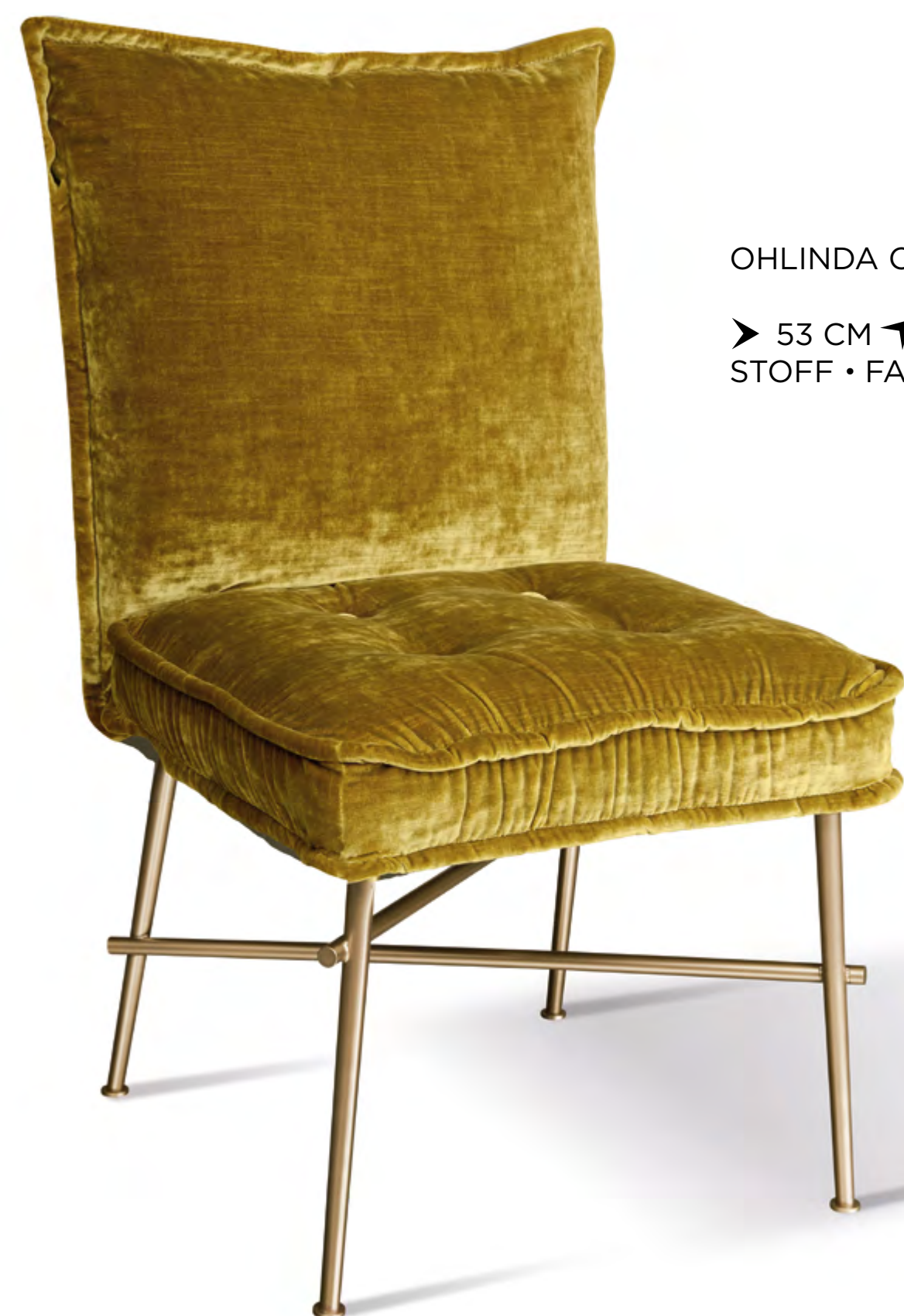
OHLINDA CHAIR A 118 ➤ 53 CM ▴ 68 CM ▲ 90 CM STOFF • FABRIC • TISSU 641978