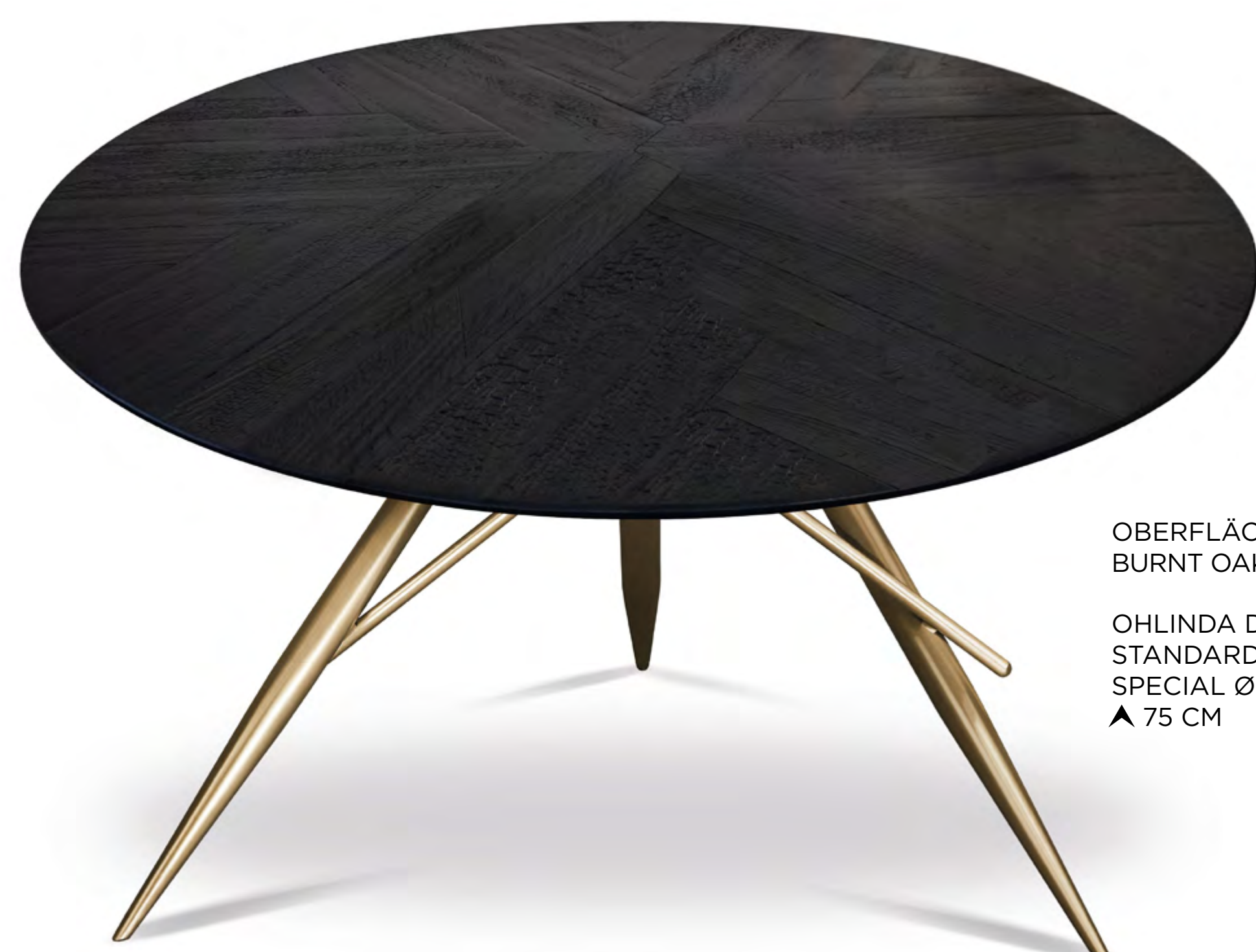
OBERFLÄCHE • SURFACE • SURFACE BURNT OAK