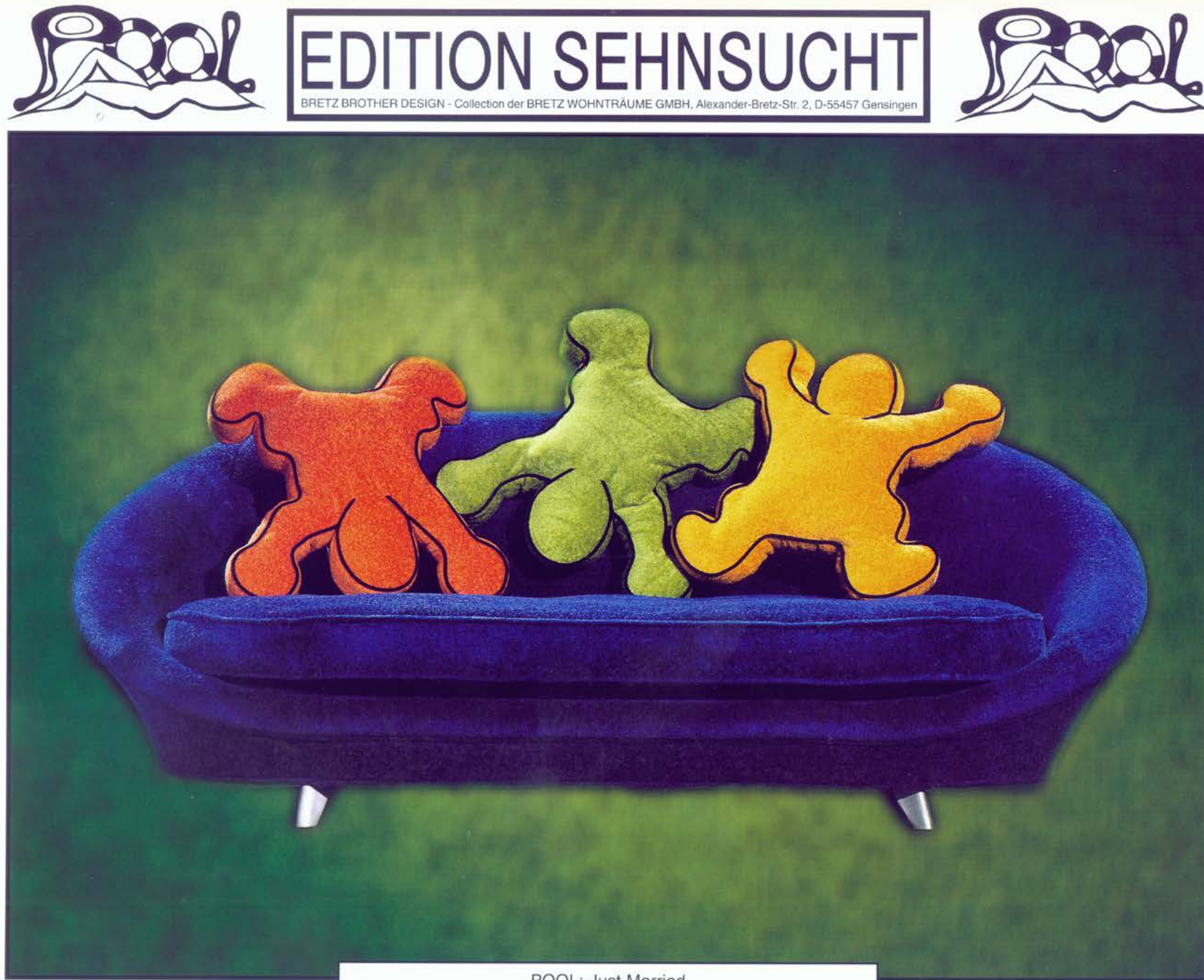
POOL: Just Married

A propos du produit de niche au „Rebelle du rembourrage“