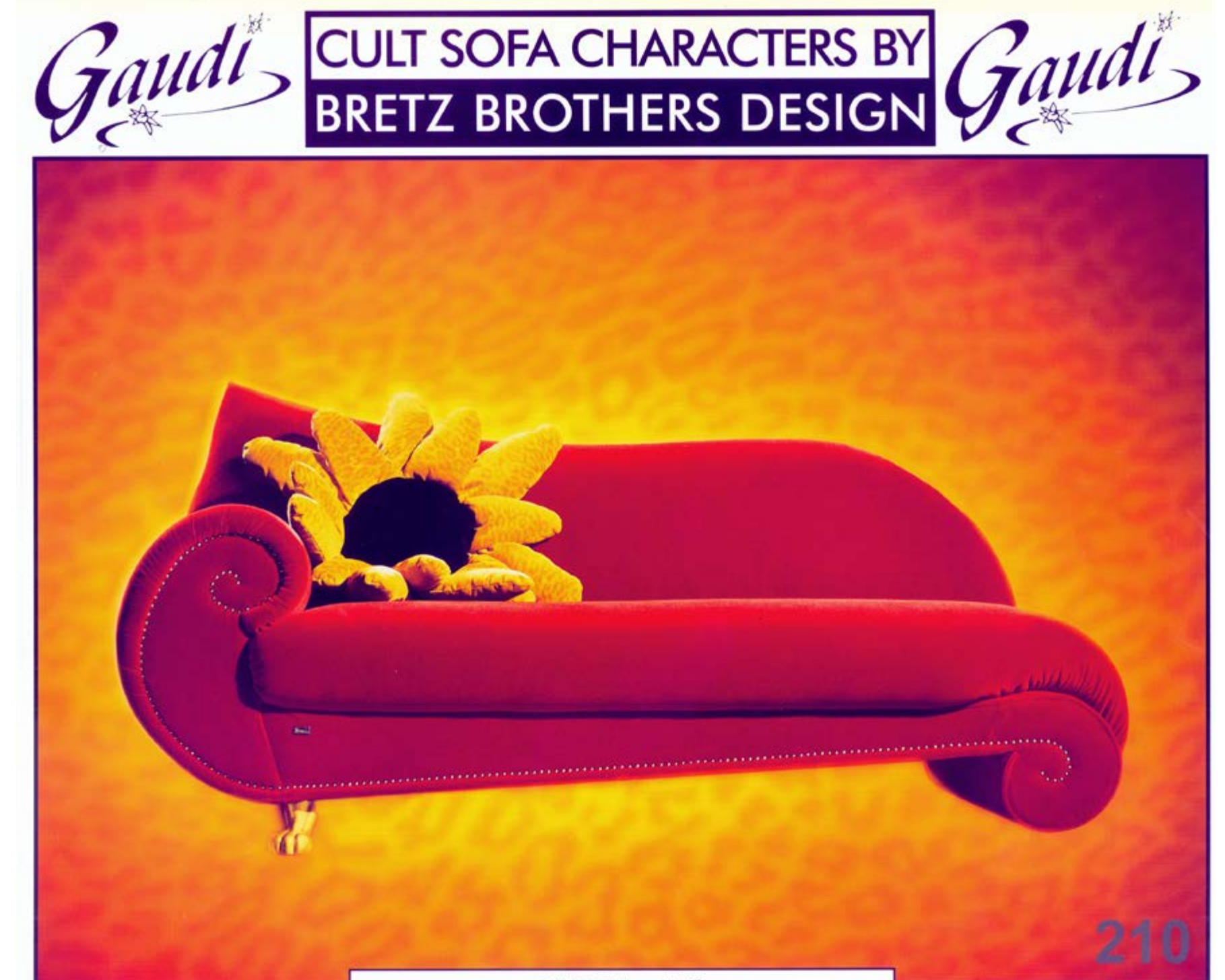
GAUDI: Blühend heiß.