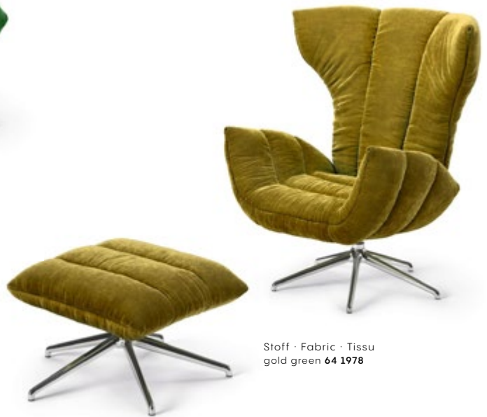
Stoff · Fabric · Tissu gold green 64 1978