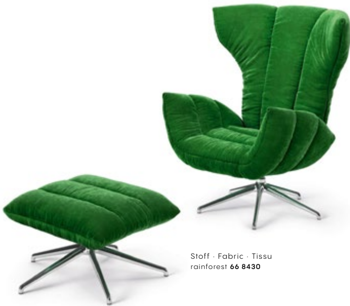
Stoff · Fabric · Tissu rainforest 66 8430