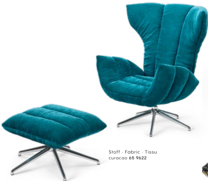
Stoff · Fabric · Tissu curacao 65 9622