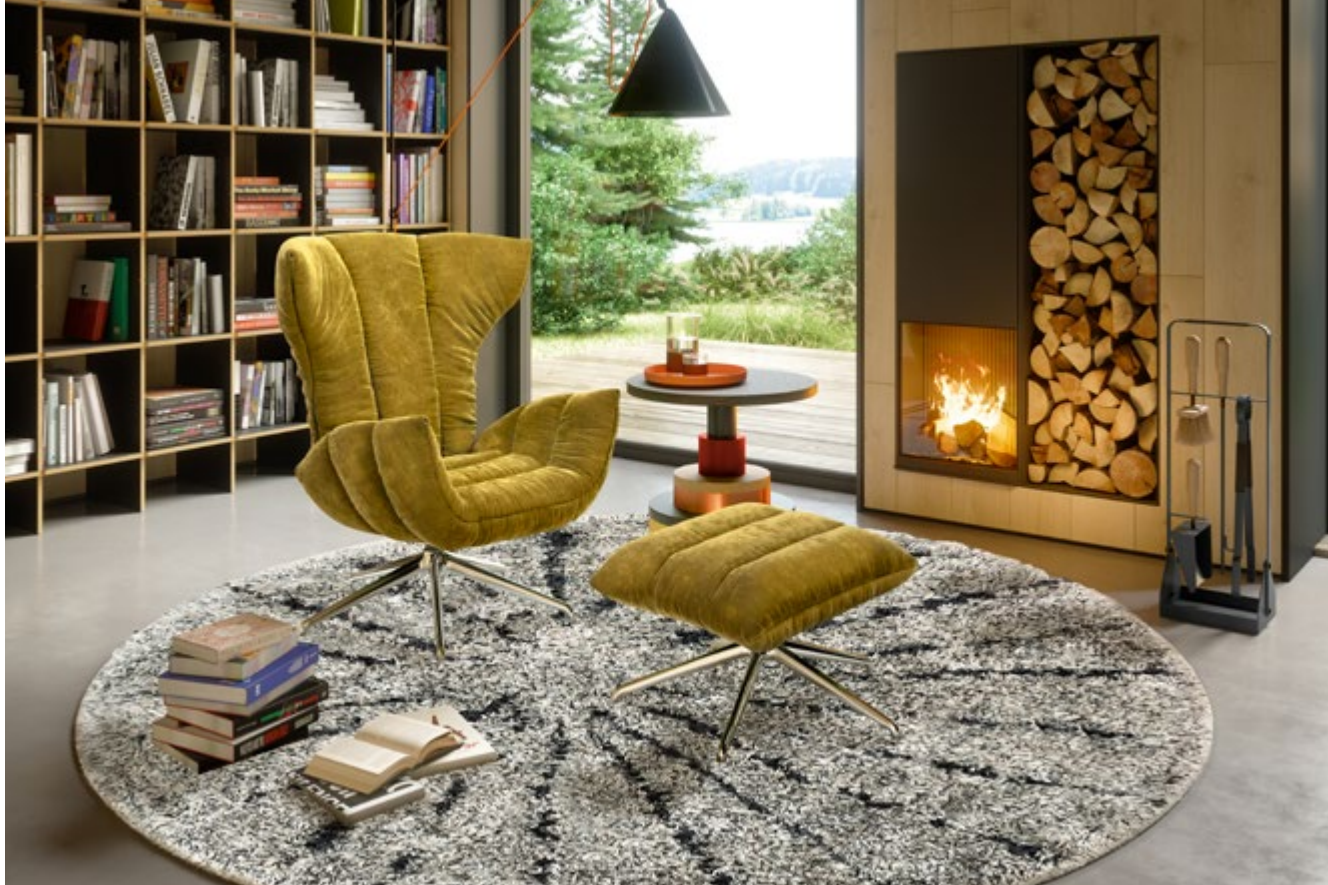
A 156 Cassia ▶ 85 cm ▼ 88-95 cm ▲ 107 cm Stoff · Fabric · Tissu 65 9675 Fuß · Feet · Pied 82