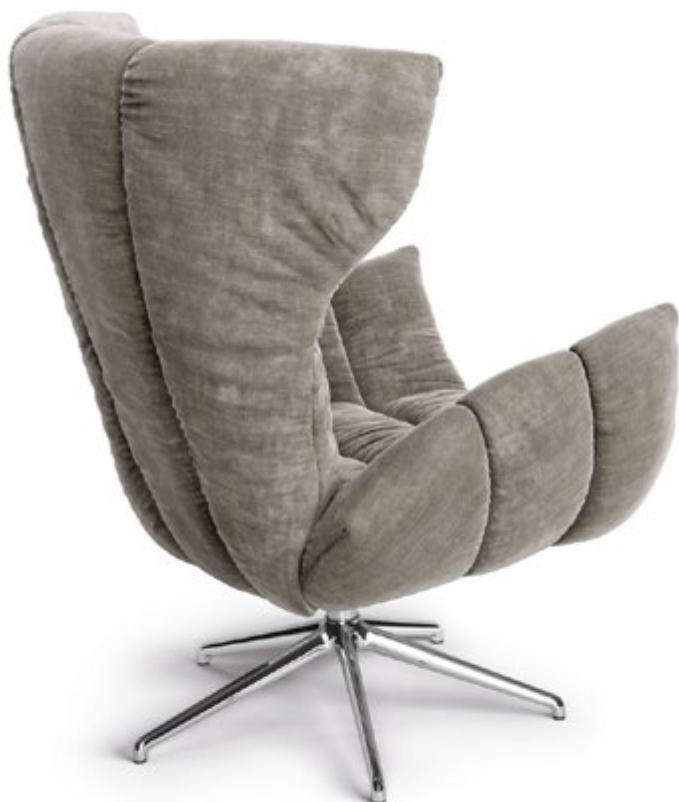
A 156 Cassia ▶ 85 cm ▼ 88-95 cm ▲ 107 cm Stoff · Fabric · Tissu 64 1985 Fuß · Feet · Pied 82

Les discussions les plus intimes en toute confiance. Cassia Loungechair offre une telle forme de sécurité communicative en s'ouvrant et se refermant tout comme un cannellier. Le châssis sur lequel le fauteuil peut également tourner et s'incliner, rend possible des conversations avec ardeur.