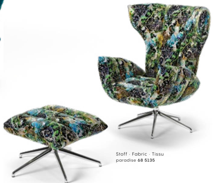
Stoff · Fabric · Tissu paradise 68 5135